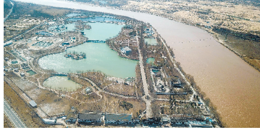
这是3月31日无人机拍摄的黄河托克托县段景色。记者从4月27日黄河防总召开的2022年黄河防汛抗旱工作视频会议上获悉，今年夏季黄河流域降水整体偏多，黄河流域中下游地区可能出现区域性暴雨洪涝灾害，防汛抗旱形势依然严峻。