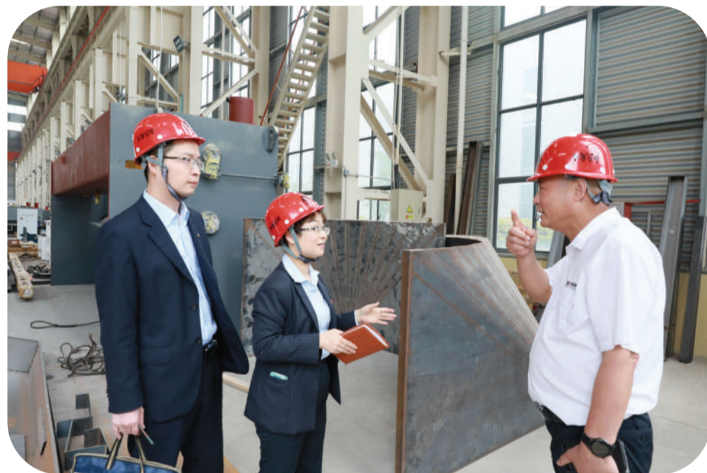
建行马鞍山市分行为基础设施提升改造项目提供资金支持,因为客户经理走进企业生产车间了解生产经营情况。(资料图片)

落子布局,不止于此。建行安徽省分行还推出一系列“实招”,通过聚焦服务重点客户、重点项目,持续强化与蔚来汽车、比亚迪等重点高新技术企业的合作,有力支持新兴产业集群发展。同时,该行聚焦经济社会发展重点和民生痛点,定制化创新信贷产品,创新亩均贷、设备购置贷、科技贷、人才贷等产品,为科创企业播撒“及时雨”,用金融活水滋养科创企业成长,助力科创“小苗”长成“大树”。