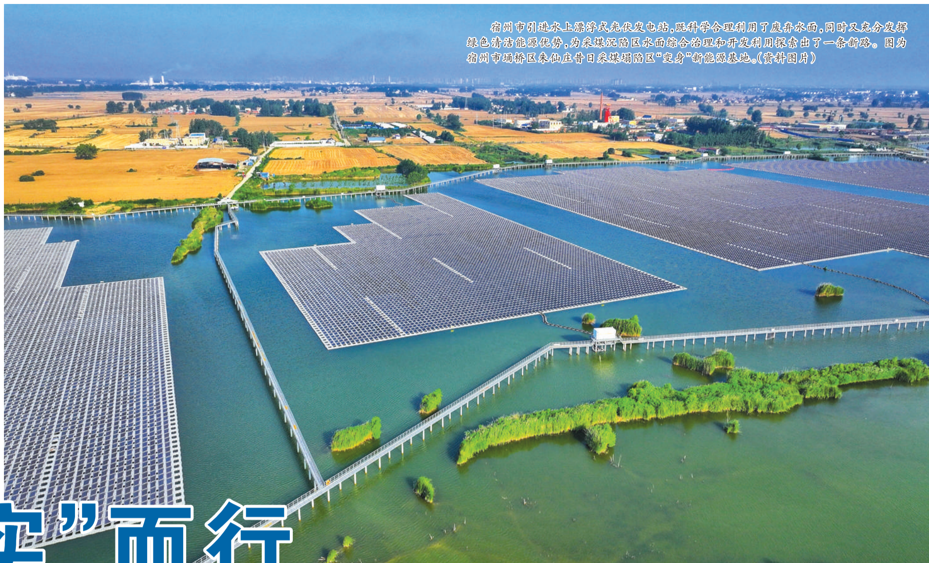
宿州市引进水上漂浮式光伏电站,既科学合理利用了废弃水面,同时又充分发挥绿色清洁能源优势,为采煤沉陷区水面综合治理和开发利用探索出了一条新路。图为宿州市埇桥区朱仙庄昔日采煤沉陷区“变身”新能源基地。(资料图片)

实体稳,经济稳。近年来,建行安徽省分行坚守金融本源,围绕加大信贷供给、聚焦服务重点领域、完善助企纾困政策等方面,全力服务实体经济,助力稳经济大盘,奋力争当服务安徽经济高质量发展的“金融尖兵”,助力现代化美好安徽建设。