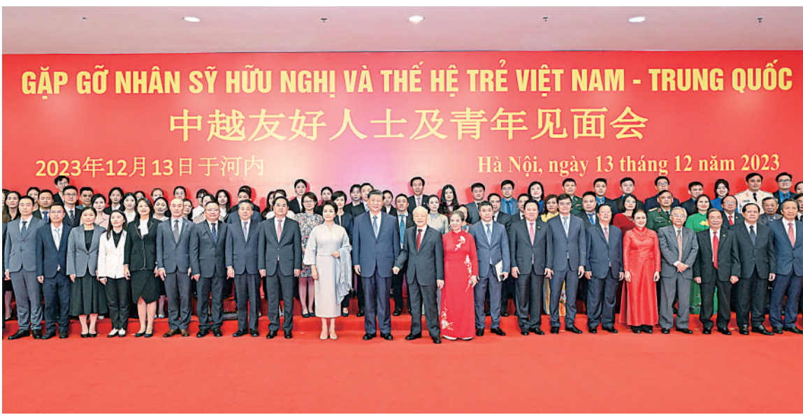
当地时间12月13日下午,中共中央总书记、国家主席习近平和夫人彭丽媛在河内同越共中央总书记阮富仲夫妇共同会见中越两国青年和友好人士代表。这是习近平夫妇和阮富仲夫妇同中越两国青年和友好人士代表亲切合影。

新华社河内12月13日电 当地时间12月13日下午,中共中央总书记、国家主席习近平和夫人彭丽媛在河内同越共中央总书记阮富仲夫妇共同会见中越两国青年和友好人士代表。 习近平和彭丽媛抵达国家会议中心时,受到越方青年代表热烈欢迎。 习近平夫妇和阮富仲夫妇同中越两国青年和友好人士代表亲切合影。 中越友好人士及青年见面会现场气氛热烈,鲜花和两国党旗国旗交相辉映,汇成一片喜悦的海洋。 在热烈的掌声中,习近平发表题为《赓续传统友谊,开创中越命运共同体建设新征程》