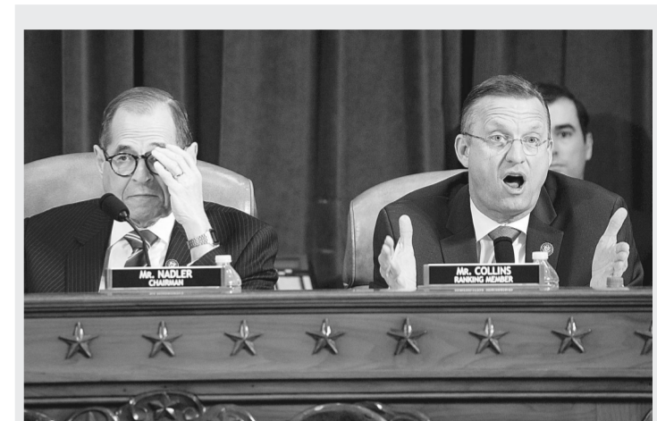
12月4日,在美国华盛顿,众议院司法委员会主席、民主党人杰里·纳德勒(左)和众议院司法委员会资深少数党成员、共和党人道格·柯林斯出席听证会。

今年8月,一名格鲁吉亚籍男子在德国柏林遭枪击身亡。事发后,德方逮捕一名俄罗斯籍嫌疑人。鉴于“俄方拒绝配合德方调查”,德国外交部12月4日宣布将两名俄罗斯驻德使馆工作人员驱逐出境。