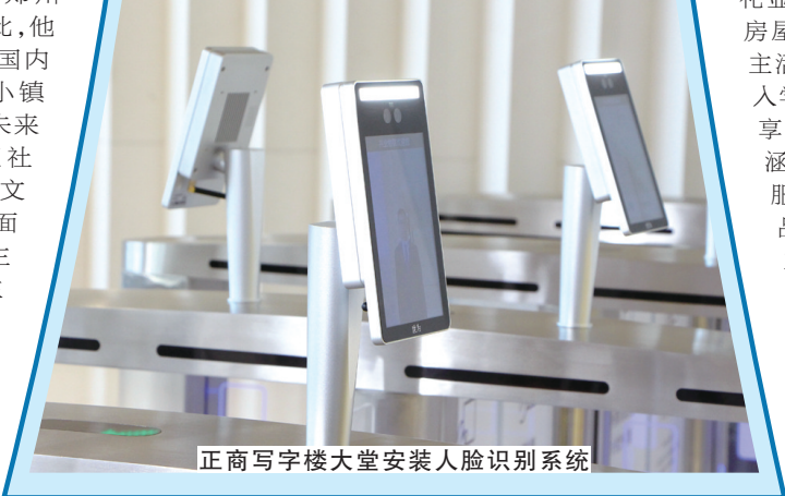
正商写字楼大堂安装人脸识别系统

正商25年,一直秉承“为优秀人群创造品质生活”的企业使命,一直行走在品质的正道上。从2013年金秋时节正式吹响品质提升的号角,到2016年坚定不移地践行高品质建设战略,7年间,正商的品质行动散枝开叶,硕果满枝、成绩斐然、有口皆碑,正商的知名度、美誉度、忠诚度日益提升,客户满意度与日俱增。 在张敬国看来,品质是企业生存的命脉,是企业发展的基石,对高品质建设要常抓不懈,要形成高品质企业文化。他认为,“高品质建设,关键在人”,新故相推,日生不滞。对正商集团而言,高品质建设只有进行时,没有完成时。今年4月26日,正商在高品质建设上再推新举措:“高品质更精品”2019年正商集团首席品质官、首席客服经理发布会在正商智慧城多功能厅举行,由正商集团副总裁、研发设计负责人等组成的数十名首席品质官、首席客服经理集体上岗,以方阵的形式整体亮相。这也意味着在总结完善过去六年高品质建设经验的基础上,正商对高品质建设提出了更具体、更实际的要求,抓落實、抓执行力度更强,也将进一步推动正商高品质建设走向纵深。