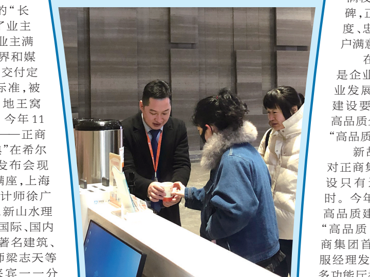
正商物业给业主送上姜茶