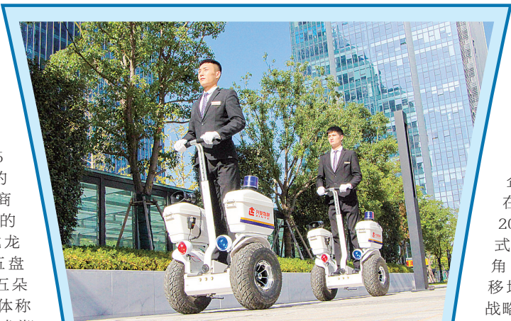
兴业物联秩序员巡查