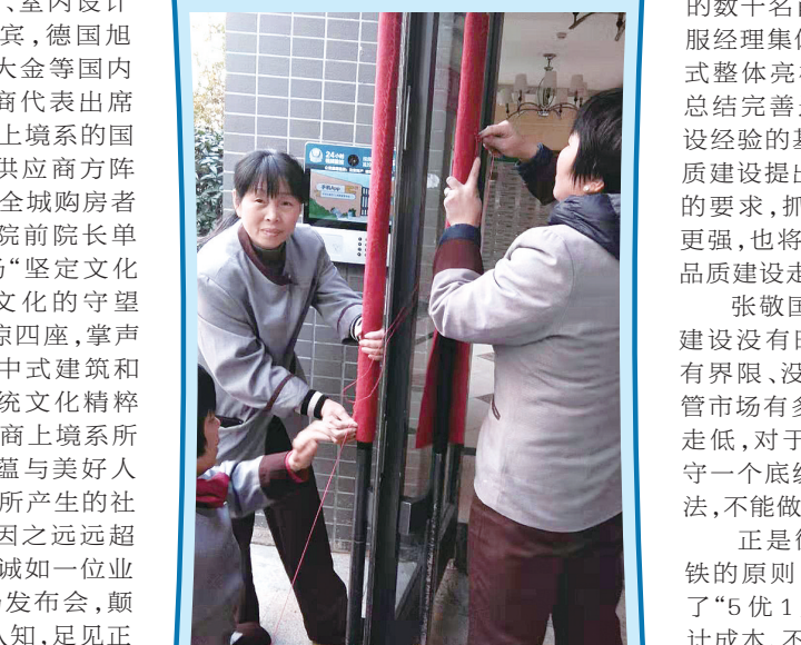
正商物业给大堂大门拉手安装保暖套