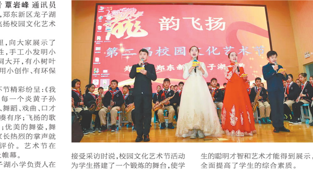
接受采访时说,校园文化艺术节活动为学生搭建了一个锻炼的舞台,学生的聪明才智和艺术才能得到展示,全面提高了学生的综合素质。

郑东新区龙子湖小学负责人在接受采访时说,校园文化艺术节活动为学生搭建了一个锻炼的舞台,学生的聪明才智和艺术才能得到展示,全面提高了学生的综合素质。