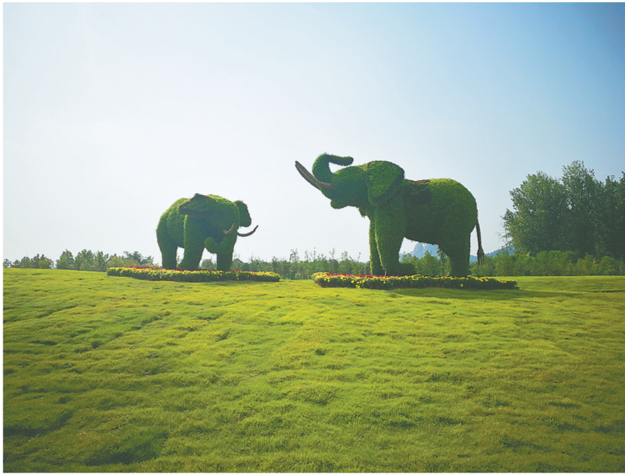
风景如画的郑州黄河文化公园一角

我市适时将文物普及教育和保护利用常识纳入中小学和干部教育培训体系,完善中小学利用博物馆学习长效机制,公布一批中小学社会实践基地和博物馆基地。同时编制文物价值全媒体传播计划,加强文博创意产品研发和古代制作技艺恢复及遗产纪录,广泛传播文物蕴含的历