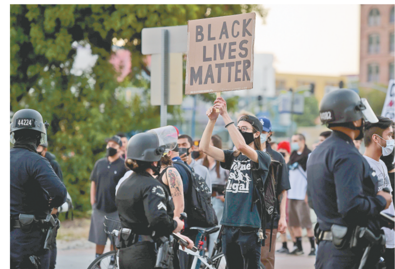
5月27日，在美国洛杉矶，一名抗议者手持写有“黑人的命也是命”字样的标语参加抗议活动。

美国明尼苏达州白人警察涉嫌执法不当致黑人男子乔治·弗洛伊德引发的骚乱持续升级，明尼苏达州州长蒂姆·沃尔兹28日签署行政令，宣布进入紧急状态并启用州国民警卫队协助维护治安。