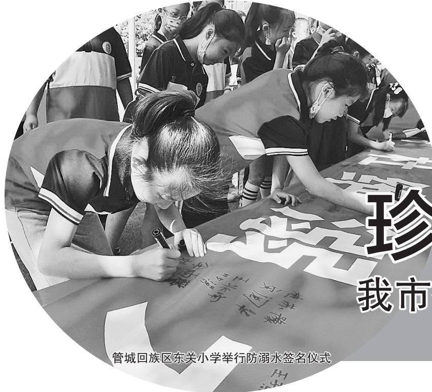
管城回族区东关小学举行防溺水签名仪式

在和孩子们的相处过程中,他们建立了深厚的亦师亦友的关系,班里的画画小能手还老师画了画像。“在学生心中埋下小小的梦想种子,可能这就是支教的意义所在。”两位老师如是说。