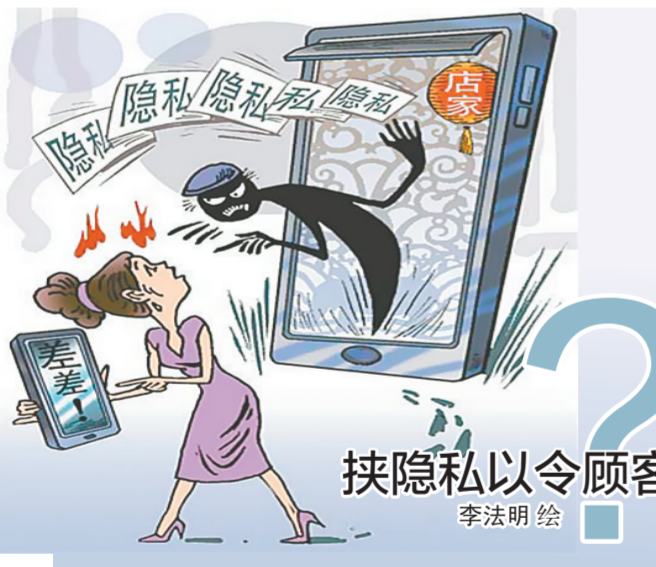
挟隐私以令顾客 李明绘