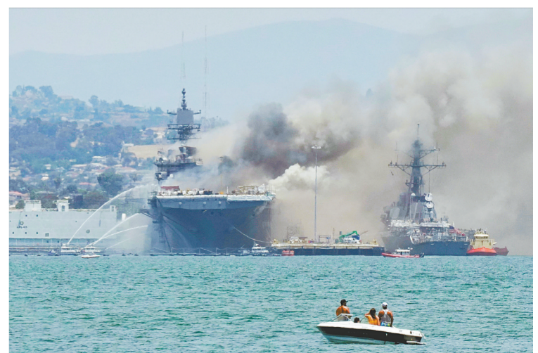
7月12日,消防船在起火的美国加利福尼亚州圣迭戈海军基地灭火。新华社发