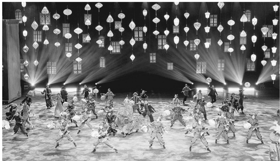
《穿越德化街》将于春节在电影小镇首演

本报讯(记者 成燕文/图) 牛年春节,新剧《穿越德化街》将在郑州建业·华谊兄弟电影小镇首演。经过三个月升级改造,郑州方特梦幻王国将于2月12日焕新回归,推出深受亲子家庭喜爱的“去熊出没之家过大年”主题活动;银基冰雪世界将推出雪猫新春派对、新奇狗拉雪橇等全新娱乐项目……回望精彩“十三五”,在一个