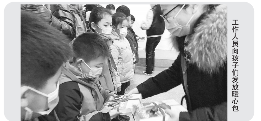
工作人员向孩子们发放暖心包

本报讯(记者 栾月琳 通讯员 冯丽竹 文/图)为进一步做好广大儿童特别是孤儿、农村留守儿童、困境儿童和中小学生的关爱服务工作,使广大少年儿童度过一个健康、安全、温暖、幸福、充满爱的寒假,惠济区妇联在全区开展“把爱带回家”2021寒假儿童关爱服务“四送”等系列活动。