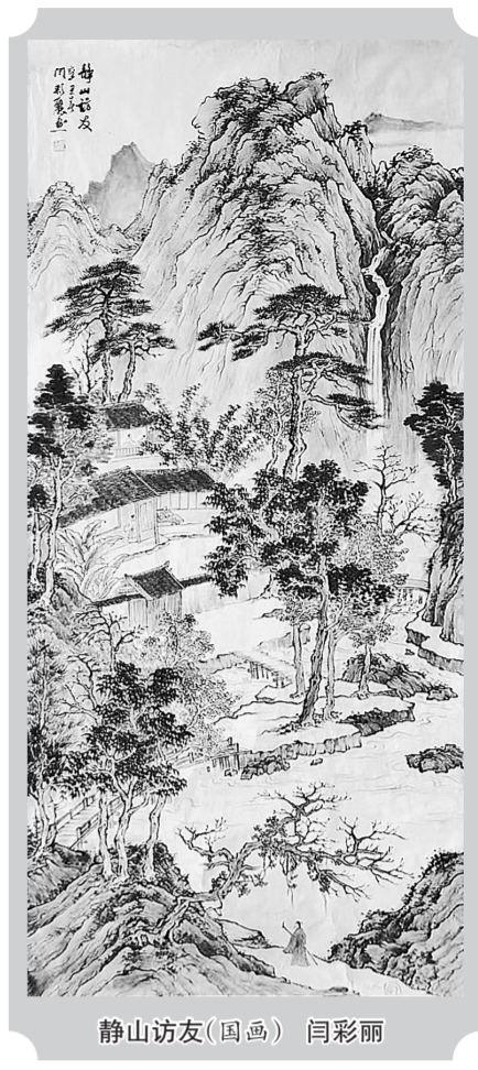
静山访友(国画) 闫彩丽

给人形象冷峻而富有斗争精神的鲁迅先生有时不免也取笑自己：“运交华盖欲何求，未敢翻身已碰头；破帽遮颜过闹市，漏船载酒泛中流。”但这并不妨碍他“横眉冷对千夫指，俯首甘为孺子牛”。苏东坡“自笑平生为口忙，老来事业转荒唐”，但这也影响他一生心念苍生，为官一任，造福一方。冯骥才曾笑自己是“丐帮的首领”，但他并没有停下为抢救和保护民间文化遗产而深入僻乡旷野考察的脚步，照样常常搞得灰头土脸。有时自嘲一下或幽自己一默，也是一种自我放松或调整吧，喘口气，掸掸灰尘，然后收拾心情，重整行装，继续前行。