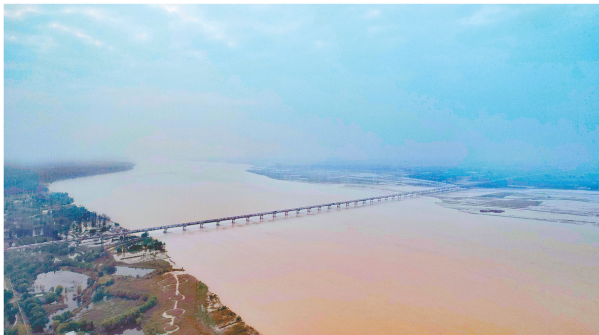
这是10月9日拍摄的郑州附近的黄河(无人机照片)

9天内发生3次编号洪水,小浪底水库水位屡创新高,下游部分河段洪水频频超警,今年的黄河秋汛非同一般。目前,黄河大流量过程仍在持续,防御形势依然严峻,罕见秋汛洪水的最后一程将如何防?