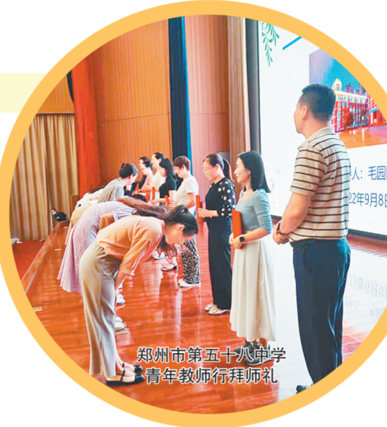
郑州市第五十八中学青年教师拜师礼

构建青年教师培养体系，成立教师成长共同体，通过丰富的实践活动搭建平台，以课题研究促进教师专业化成长……为了提升教师教育教学水平，从而为学生提供更优质的教育服务，我市各校都十分重视教师的培养，通过多种创新举措促进教师专业成长，也为教育事业的发展注入新的活力和动力。