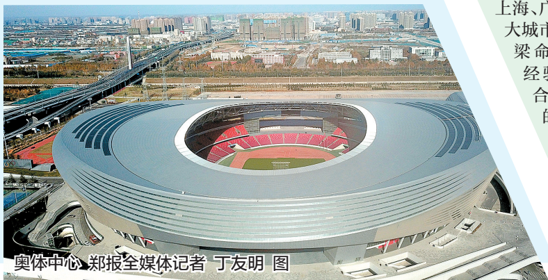
奥体中心