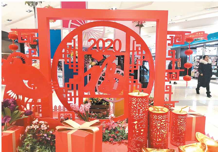
郑州一超市内充满节日氛围

据悉,国家综合型信息消费示范城市的成功创建,将进一步扩大我市信息消费规模,提升信息消费水平,进一步推动以智能终端、信息安全、软件和信息技术服务等为代表的电子信息产业发展,为全市制造业高质量发展注入新活力,为数字经济高质量发展赋予新动能,为国家中心城市建